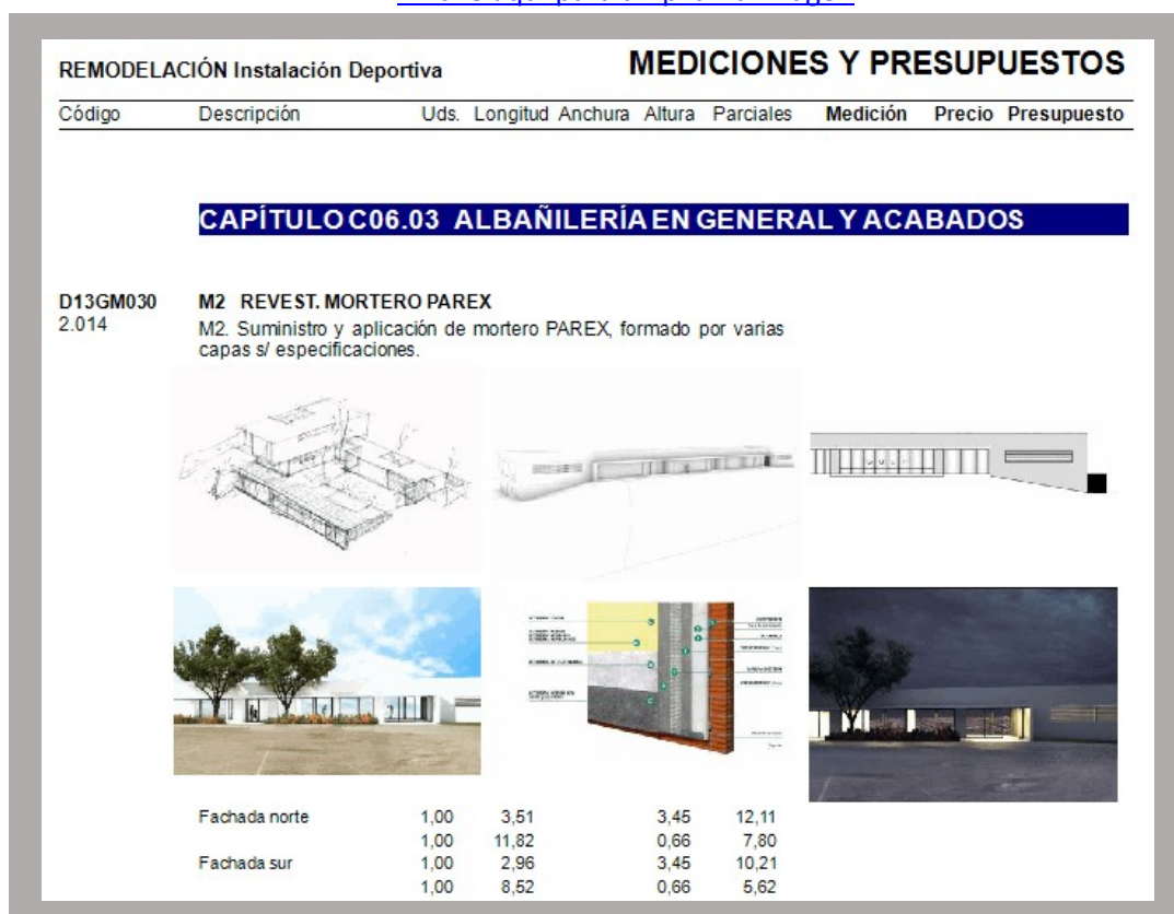
IMAGEN 1 (hojas del presupuesto)

Hoja del presupuesto del proyecto inicial al cual se le ha añadido a una partida imágenes aclaratorias y definitivas.